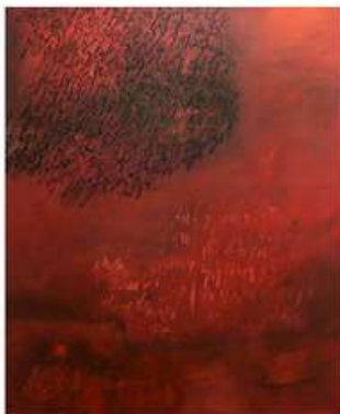
Acrílic i tinta sobre tela Acrylic and tinta sobre tela Acrylic and ink on canvas

El mar despoja de palabras la arena donde escribo mis primeros versos. Ahora me devuelve los guijarros para que los grabe con mis memorias.