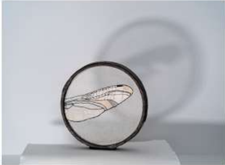
Escultura de ferro, paper i fil Escultura de hierro papel e hilo Sculpture of iron, paper and thread