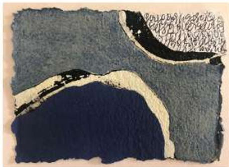
Acrílic i tinta sobre paper fet a mà Acrílico sobre papel hecho a mano Acrylic on hand made paper

Tengeix de blau el temps: transfigura el somni, transgredeix els mots. (Montserrat Abelló, Foc a les mans, 1990)