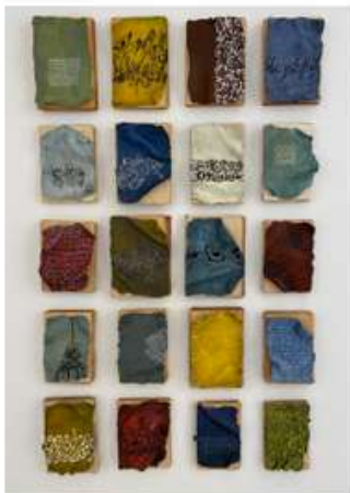
Instal·lació. Tècnica mixta sobre fang i llibres vells Instalación: Técnica mixta sobre barro y libros antiguos Installation: Mixed technique on mud and old books

Mi letra. Como quien dice: mi casa, mi país, mi amor.