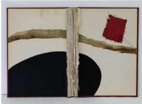
Tècnica mixta sobre paper i llibre antic Técnica mixta sobre papel y libro antiguo Mixed media on paper and old book