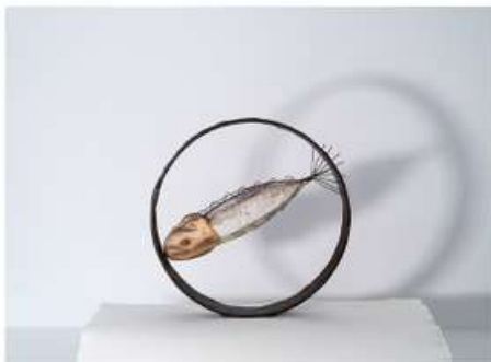
Escultura de ferro, filferro, fusta i paper Escultura de hierro, alambre, madera y papel Sculpture of iron, wire, wood and paper

Queremos poder volar; y si queremos volar, volamos.