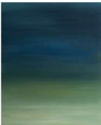
Acrílic sobre tela Acrílico sobre tela Acrylic on canvas

El viento no hace ruido pero tu lo sientes cuando toca las cosas. Así, el poema.