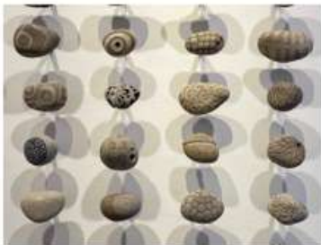
Instal·lació. Gravat sobre pedra i alguna intervenció amb tinta Instalación. Gravado sobre piedra e intervenciones con tinta Installation. Engraving on stone and ink