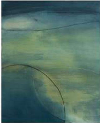
Acrílic i tinta sobre tela Acrílico y tinta sobre tela Acrylic and ink on canvas