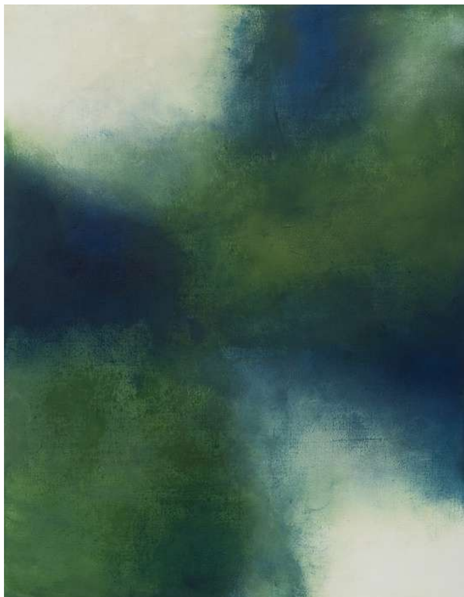
Els colors del vent, 2021. Acrílic i tinta sobre tela 146 x 114 cm