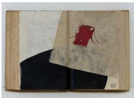
Tècnica mixta sobre paper i llibre antic Técnica mixta sobre papel y libro antiguo Mixed media on paper and old book

Tiñe de azul el tiempo: transfigura el sueño, transgrede las palabras.