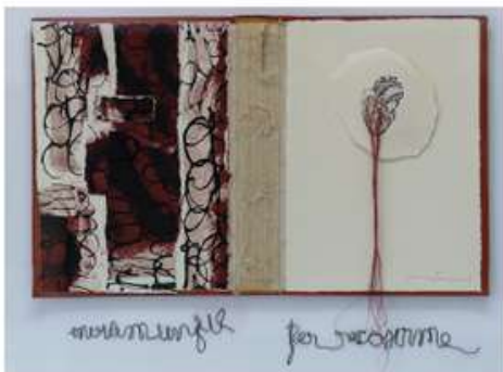
Tècnica mixta sobre paper i llibre antic Técnica mixta sobre papel y libro antiguo Mixed media on paper and old book