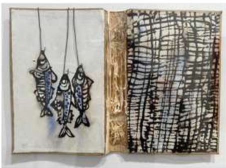
Tècnica mixta sobre paper i llibre antic Técnica mixta sobre papel y libro antiguo Mixed media on paper and old book