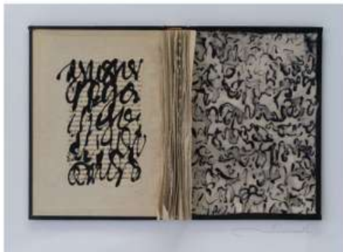
Tècnica mixta sobre paper i llibre antic Técnica mixta sobre papel y libro antiguo Mixed media on paper and old book