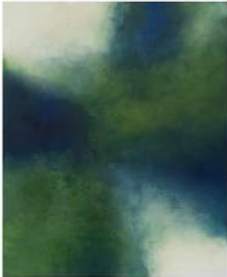
Acrílic sobre tela Acrílico sobre tela Acrylic on canvas