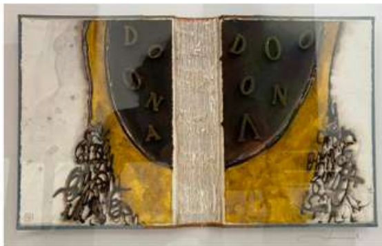
Tècnica mixta sobre paper i llibre antic Técnica mixta sobre papel y libro antiguo Mixed media on paper and old book